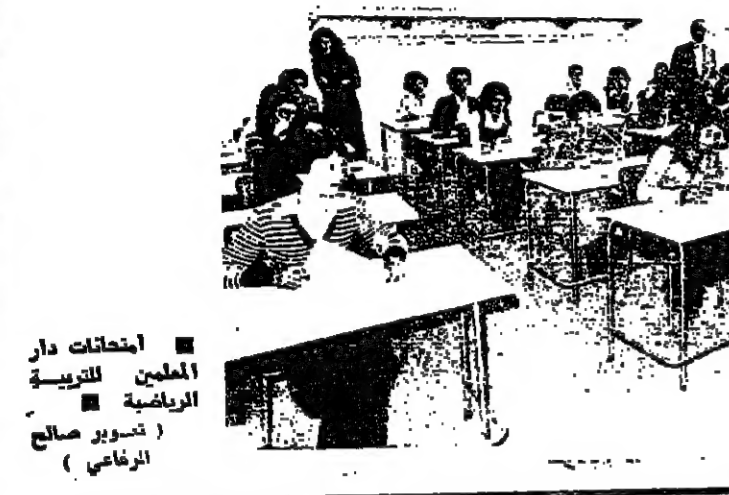
امتحانات دار المعلمين للتربية الرياضية

دار المعلمين للتربية الرياضية تشهد هذا العام انخفاً كبيراً من حيث الاعداد المقدمة . فقد جرت منذ يومين وللمرة الاولى بعد الاحداث اول امتحانات قبول للسنه الاولى ، تقدم اليها ٥٠ طالب وطالبة ترشح منهم فعلياً ٣٠٠ ، على الاسئلة كانت متعقبة وعلى الطريقة ان يتم اختيار ٢٠ خاتمة و ٢٠ شاباً ، الامر الذي يجعل ١٥٥ سؤالا تكون اجوبتهم بنصف او لا . وامس جرت الامتحانات التطبيقية للطلاب في الهيئة الرياضية ، واليوم تجري للبنات في الهيئة الرياضية ايضا . وتتوالى الامتحانات التطبيقية ، المتضمنة الرياضية على مختلف انواعها من ركض وجري وتمرير عابدين ، وبموجب ان يكون عدد الفاترين لا يلبس به ، خصوصا وان اسلوب الامتحانات المتقدم هو اميركي ، وهذا الاسلوب مستحب لدى الطلاب ، وسبل كما انه يعطي صورة واضحة عن معرفة الطالب .